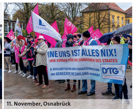
11. November, Osnabrück