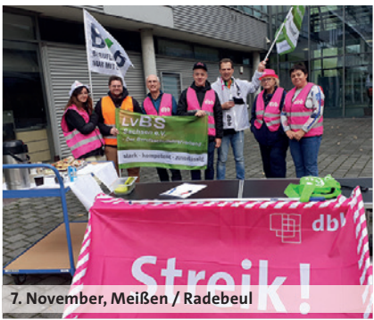
7. November, Meißen / Radebeul