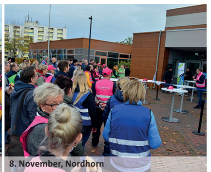
8. November, Nordhorn