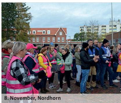
8. November, Nordhorn