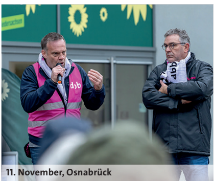
11. November, Osnabrück