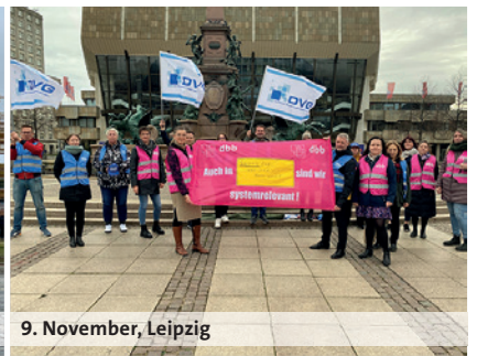
9. November, Leipzig