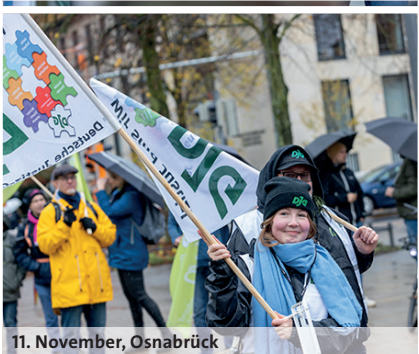
11. November, Osnabrück