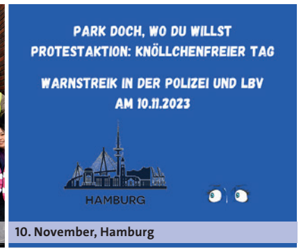
10. November, Hamburg