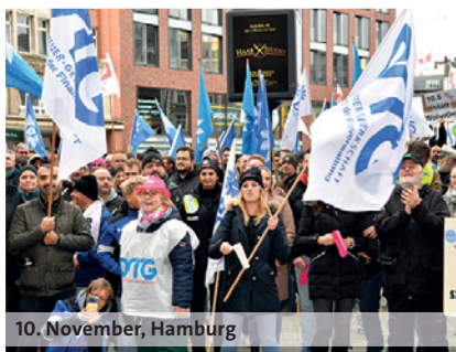
10. November, Hamburg