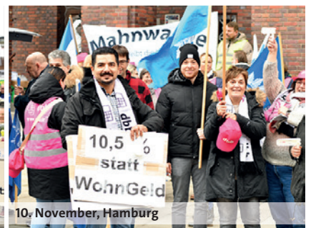
10. November, Hamburg