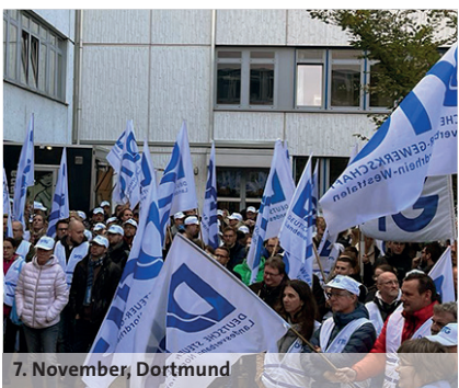
7. November, Dortmund