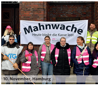
10. November, Hamburg