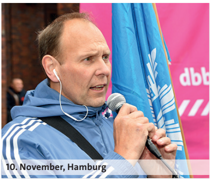
10. November, Hamburg