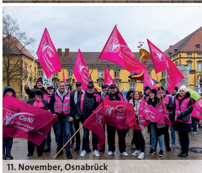
11. November, Osnabrück