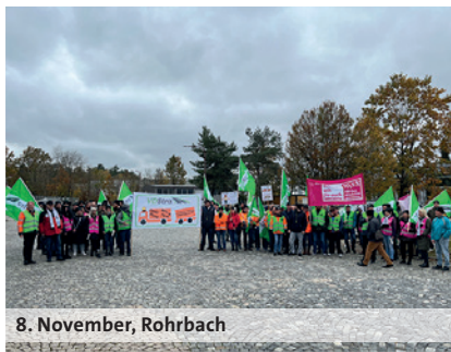
8. November, Rohrbach