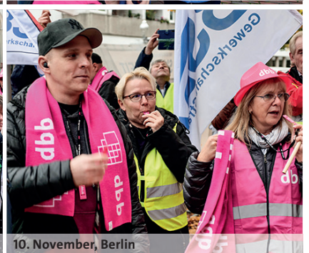
10. November, Berlin