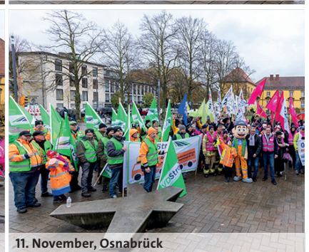
11. November, Osnabrück