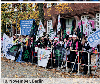
10. November, Berlin