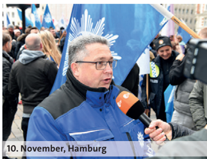
10. November, Hamburg

dbb: wir. für euch. 10,5% 500 Euro mindestens