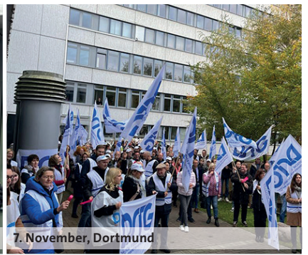
7. November, Dortmund

nanzen als Basis einer funktionierenden Infrastruktur werden personell ausbluten. Wertschätzende Arbeitgeber mit attraktiven Rahmenbedingungen für Beschäftigte sehen anders aus.“