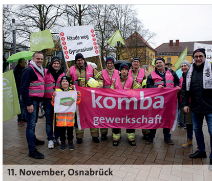
11. November, Osnabrück