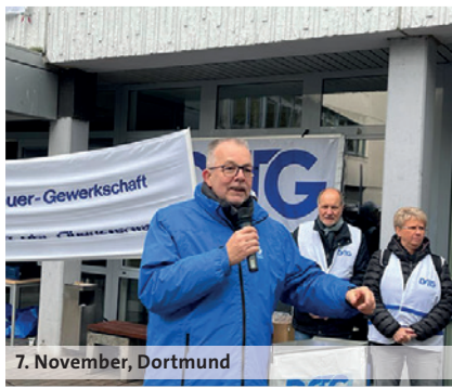
7. November, Dortmund