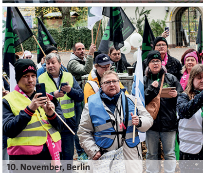
10. November, Berlin