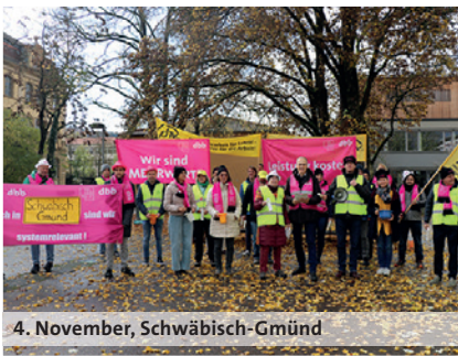
4. November, Schwäbisch-Gmünd