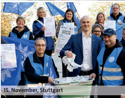
15. November, Stuttgart