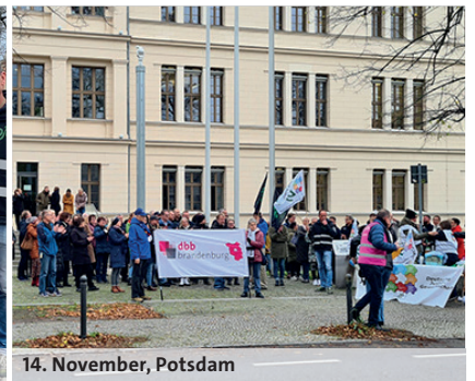
14. November, Potsdam