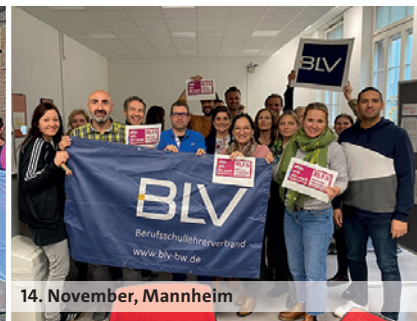
14. November, Mannheim

ten und haben vor dem Justizministerium in Saarbrücken eine Kundgebung durchgeführt. Die mehr als 250 Teilnehmenden haben lautstark gezeigt, dass sie endlich ein Angebot der TdL wollen.