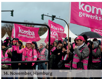
14. November, Hamburg