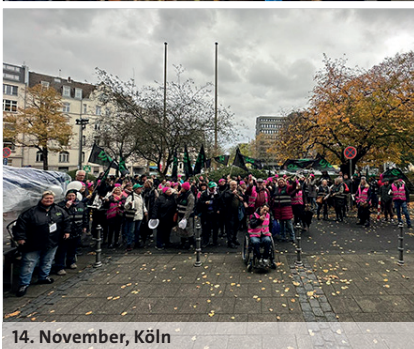
14. November, Köln