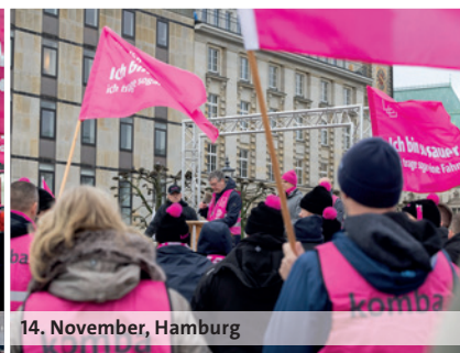
14. November, Hamburg