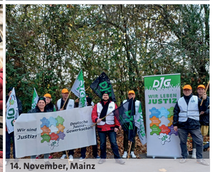
14. November, Mainz