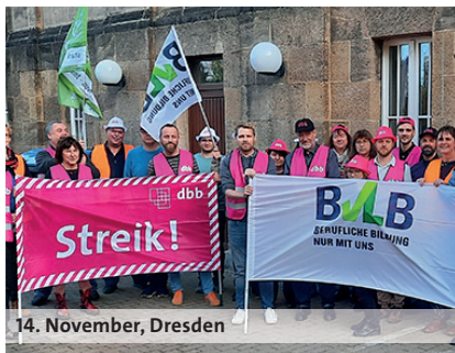
14. November, Dresden