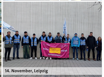
14. November, Leipzig