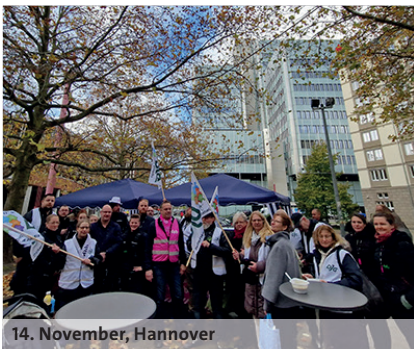
14. November, Hannover