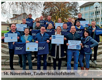
14. November, Tauberbischofsheim