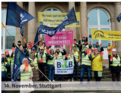
14. November, Stuttgart