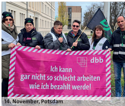
14. November, Potsdam