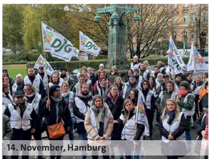
14. November, Hamburg

dbb: wir. für euch. 10,5% 500 Euro mindestens