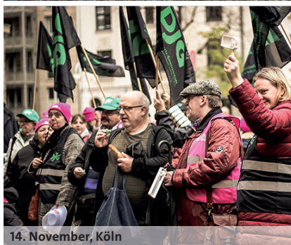
14. November, Köln