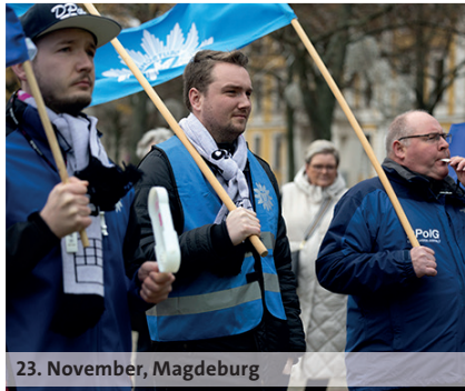
23. November, Magdeburg