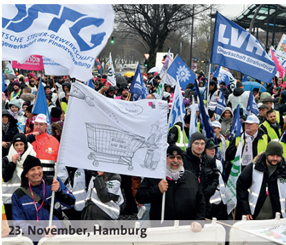
23. November, Hamburg