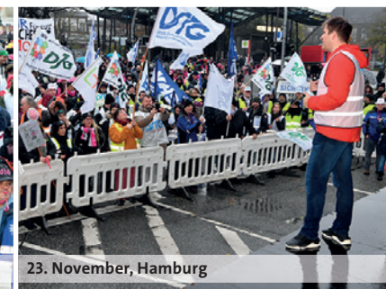
23. November, Hamburg