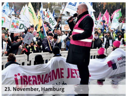
23. November, Hamburg

dbb: wir. für euch. 10,5% 500 Euro mindestens