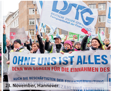
23. November, Hannover