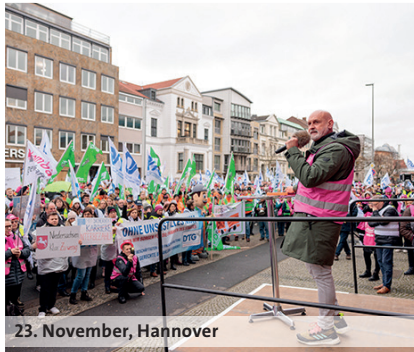
23. November, Hannover