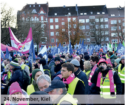
24. November, Kiel