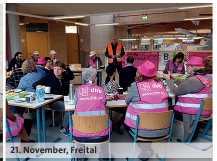
21. November, Freital

Ebenfalls am 22. November 2023 haben Mitglieder des DBSH für die Übertragung der TVöD-Ergebnisse für die Sozialarbeitenden in den TV-L demonstriert, „denn wir sind Gold wert!“.