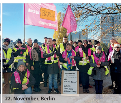
22. November, Berlin