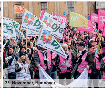
23. November, Hannover