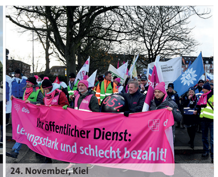
24. November, Kiel

gkl berlin gewerkschaft kommunaler landesdienst berlin in der kombi gewerkschaft