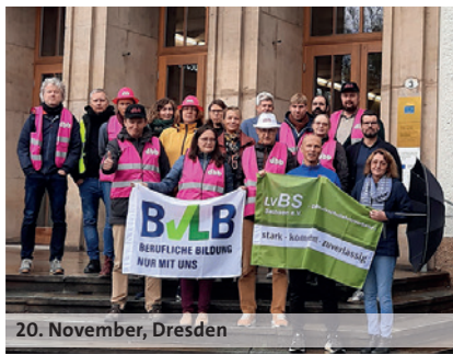
20. November, Dresden