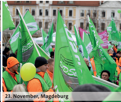
23. November, Magdeburg