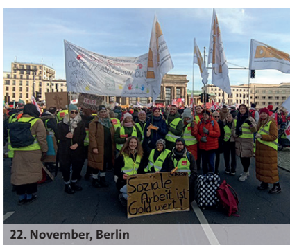
22. November, Berlin