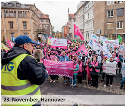
23. November, Hannover