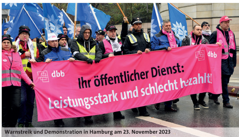
Warnstreik und Demonstration in Hamburg am 23. November 2023

Viele 1.000 Beschäftigte im Landesdienst sind vor allem im Norden in den Warnstreik getreten und haben zusammen mit ihren beamteten Kolleginnen und Kollegen für die Forderungen zur Einkommensrunde 2023 demonstriert. Die Schwerpunkte der Demonstrationen lagen in Hamburg, Hannover, Magdeburg und Kiel. Gleichzeitig wurden die vielen Mahnwachen und kleineren Aktionen fortgesetzt.