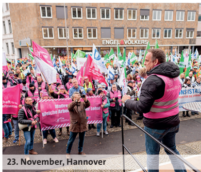
23. November, Hannover