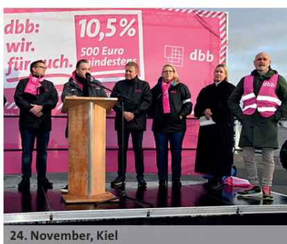
24. November, Kiel