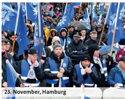
23. November, Hamburg