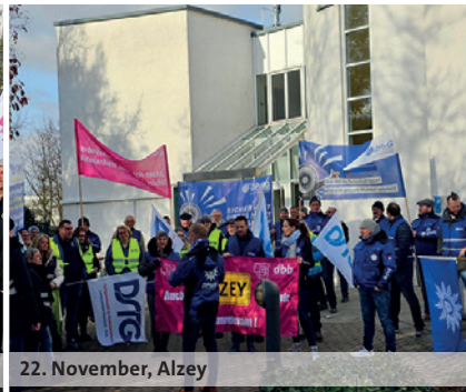
22. November, Alzey