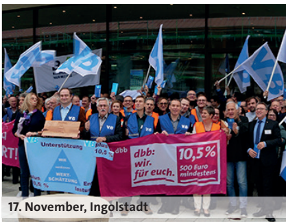
17. November, Ingolstadt