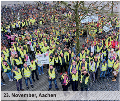
23. November, Aachen