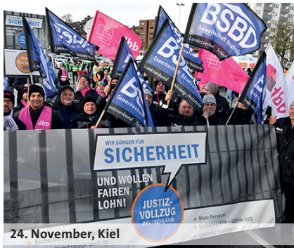
24. November, Kiel