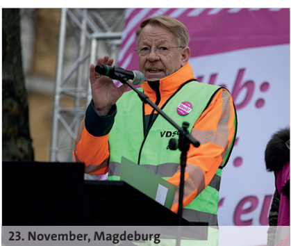
23. November, Magdeburg