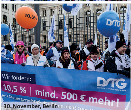
30. November, Berlin