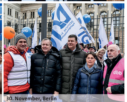
30. November, Berlin