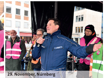
29. November, Nürnberg