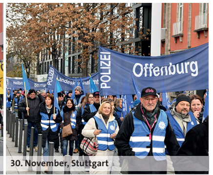
30. November, Stuttgart