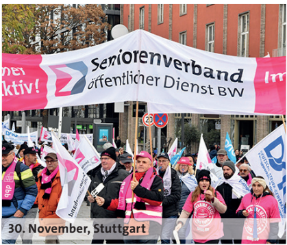
30. November, Stuttgart