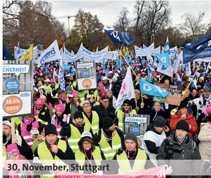
30. November, Stuttgart