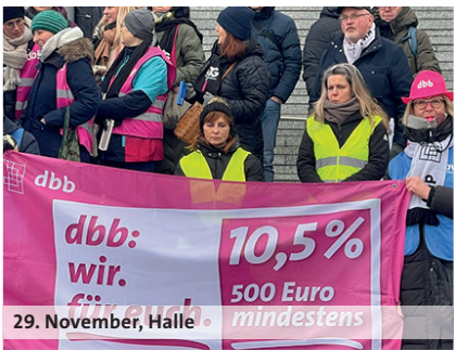
29. November, Halle