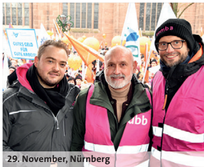
29. November, Nürnberg