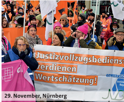
29. November, Nürnberg