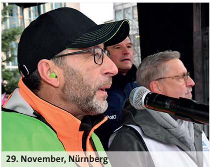
29. November, Nürnberg

Am 30. November 2023 haben Mitglieder der Deutschen Steuer-Gewerkschaft (DSTG) einen Warnstreik durchgeführt und zusammen mit verbeamteten Kolle-