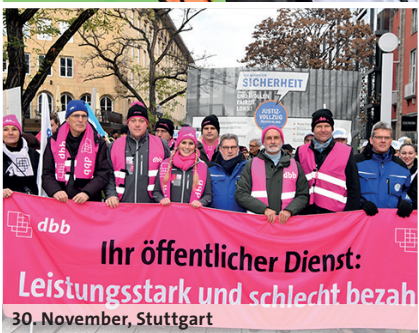
30. November, Stuttgart