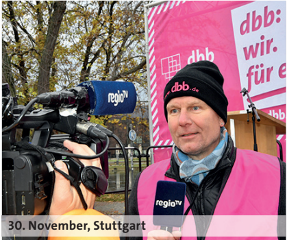
30. November, Stuttgart