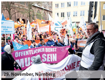
29. November, Nürnberg