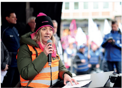
29. November, Nürnberg