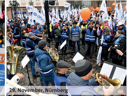
29. November, Nürnberg

nehmbar.“ Geyer weiter: „Wer Bildung, Sicherheit, Infrastruktur und Pflege will, muss die Menschen in diesen Bereichen auch angemessen bezahlen, statt an jeder Ecke zu sparen. Die Beschäftigten im öffentlichen Dienst halten Deutschland am Laufen. Wer meint, beim öffentlichen Dienst sparen zu müssen, darf sich nicht wundern, wenn der bald nicht mehr funktioniert. Mit dieser gesellschaftlichen Kurzsichtigkeit sparen sich die Länder selbst kaputt.“