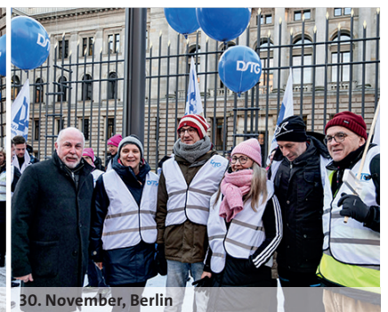
30. November, Berlin