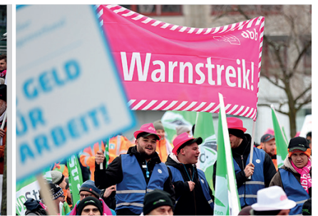
29. November, Nürnberg