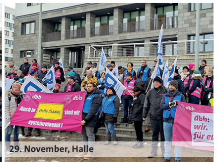
29. November, Halle