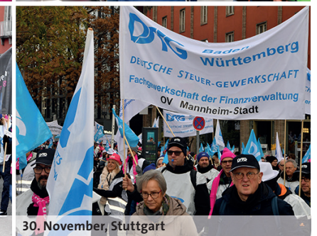
30. November, Stuttgart