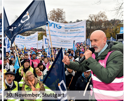
30. November, Stuttgart