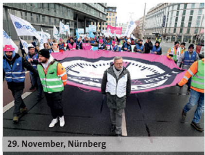
29. November, Nürnberg