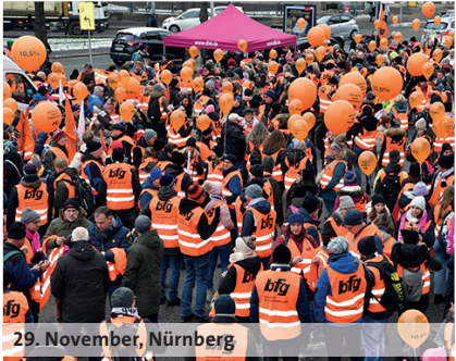
29. November, Nürnberg