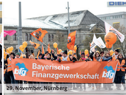
29. November, Nürnberg