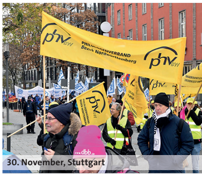
30. November, Stuttgart