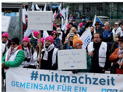
29. November, Nürnberg