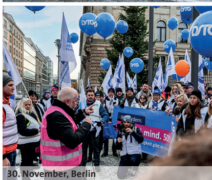
30. November, Berlin