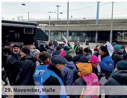
29. November, Halle