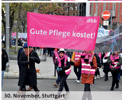
30. November, Stuttgart