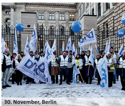
30. November, Berlin