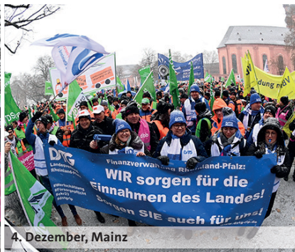
4. Dezember, Mainz