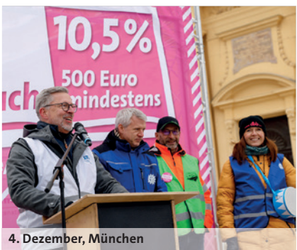
4. Dezember, München