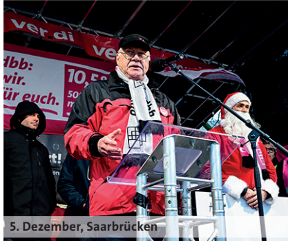
5. Dezember, Saarbrücken