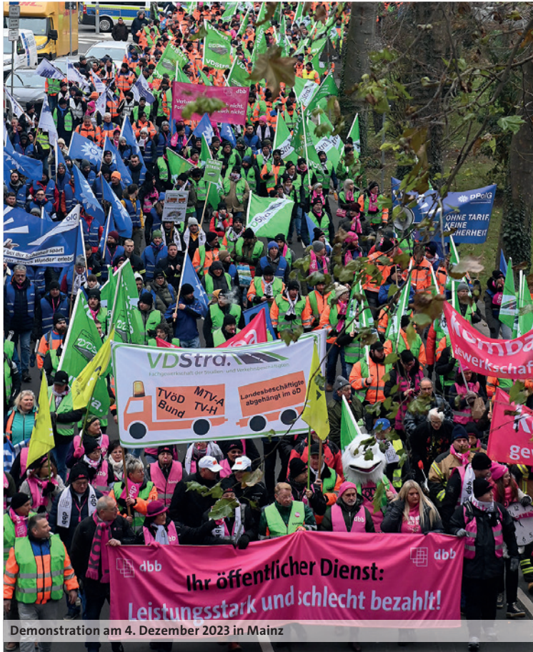
Demonstration am 4. Dezember 2023 in Mainz

Bevor ab dem 7. Dezember 2023 Gewerkschaften und Tarifgemeinschaft deutscher Länder (TdL) zur dritten Runde am Verhandlungstisch zusammenkommen, haben die Fachgewerkschaften des dbb ihre Warnstreiks, Demonstrationen und anderen Aktionen weiter ausgeweitet. Wenn die Arbeitgeber sich nicht bewegen wollen, bewegen sich eben die Kolleginnen und Kollegen – auf der Straße. Die berechtigten Forderungen der Beschäftigten bleiben: 10,5 %, mindestens 500 Euro, 200 Euro für die Azubis und unbefristete Übernahme nach der Ausbildung.