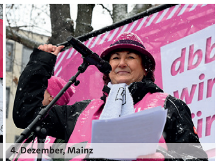
4. Dezember, Mainz