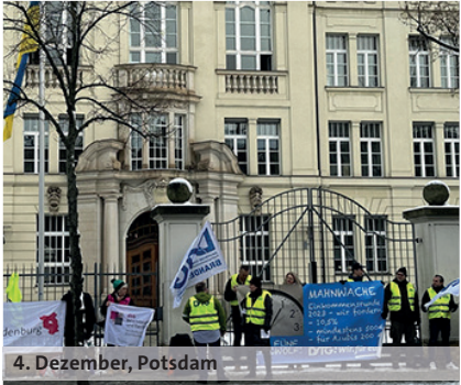
4. Dezember, Potsdam