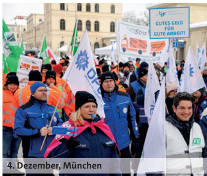
4. Dezember, München