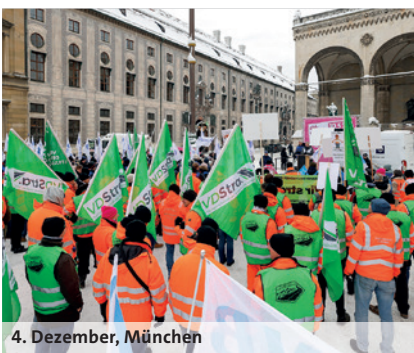
4. Dezember, München