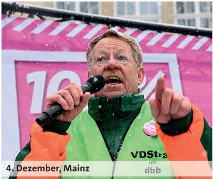
4. Dezember, Mainz