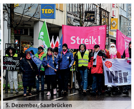
5. Dezember, Saarbrücken