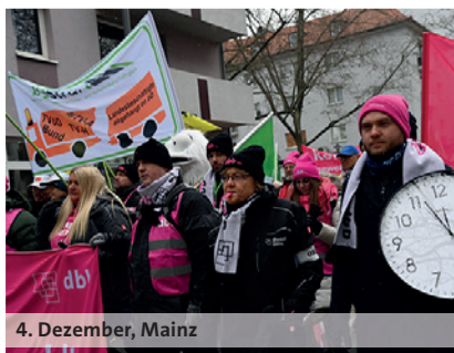
4. Dezember, Mainz