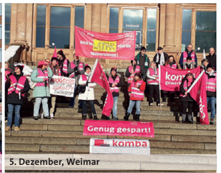
5. Dezember, Weimar