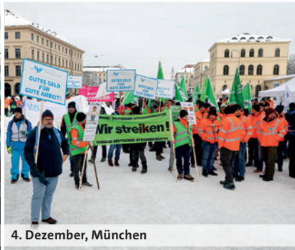
4. Dezember, München

zu erreichende Tarifiergebnis zeitgleich und systemgerecht auf die Beamtenbesoldung und Versorgung im Landes- sowie im Kommunaldienst übertragen werden. „Alle Beschäftigten müssen die wertschätzende Anerkennung bekommen, die sie verdienen. So geht Nachwuchsgewinnung und Fachkräftesicherung. Dann klappt’s auch mit dem öffentlichen Dienst. Das ist nötig und gut – für alle.“