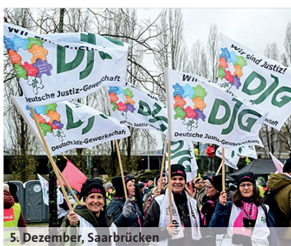
5. Dezember, Saarbrücken