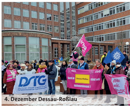
4. Dezember Dessau-Roßlau