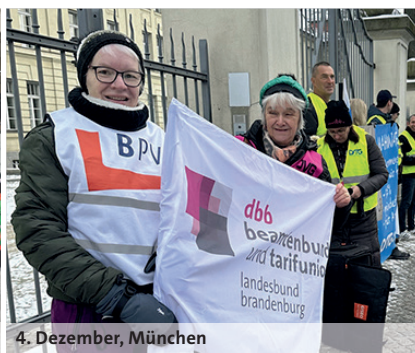
4. Dezember, München