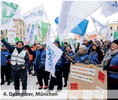
4. Dezember, München