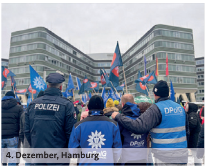
4. Dezember, Hamburg