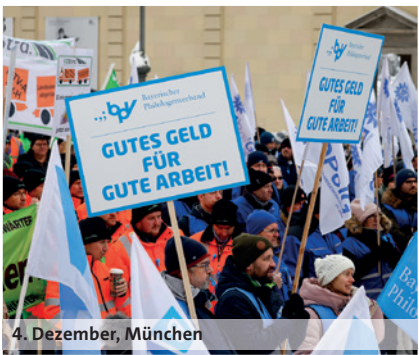
4. Dezember, München