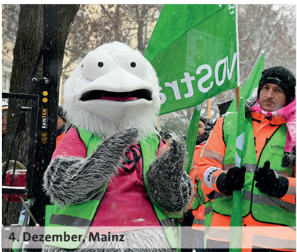
4. Dezember, Mainz