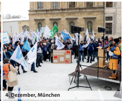
4. Dezember, München