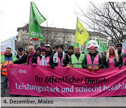
4. Dezember, Mainz