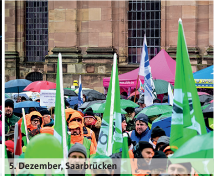
5. Dezember, Saarbrücken

regierung anwesend waren, rief Linn: „Die Kolleginnen und Kollegen im öffentlichen Dienst des Saarlandes brauchen nach den Preissprüngen der letzten Monate einen Inflationsausgleich!“ Zudem dürften die Länder im Wettbewerb auf dem Arbeitsmarkt nicht weiter abgehängt werden.