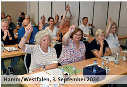
Hamm/Westfalen, 3. September 2024