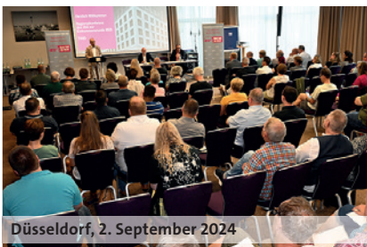
Düsseldorf, 2. September 2024